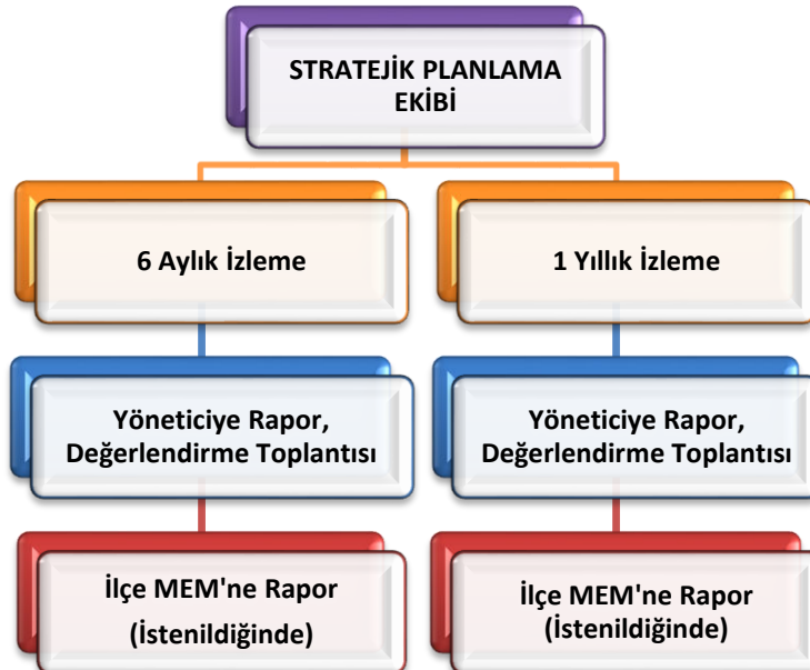
Şekil 8 Stratejik Plan İzleme ve Değerlendirme Modeli

Müdürlüğümüzün 2024-2028 Stratejik Planı İzleme ve Değerlendirme sürecini ifade eden İzleme ve Değerlendirme Modeli hazırlanmıştır. Okulumuzun Stratejik Plan İzleme-Değerlendirme çalışmaları eğitim-öğretim yılı çalışma takvimi de dikkate alınarak 6 aylık ve 1 yıllık sürelerde gerçekleştirilecektir. 6 aylık sürelerde Okul Müdürüne rapor hazırlanacak ve değerlendirme toplantısı düzenlenecektir. İzleme-değerlendirme raporu, istenildiğinde İlçe Milli Eğitim Müdürlüğüne gönderilecektir.